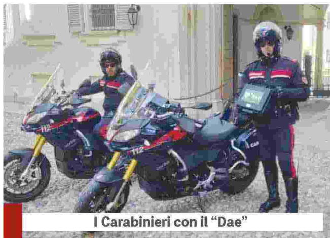
I Carabinieri con il "Dae"

un sistema di soccorso che integra la parte civile a quella sanitaria". Dopo un anno e mezzo difficile a causa della pandemia con lo stop ai corsi BLS, l'associazione Pavia nel Cuore ha ripreso pienamente l'attività di formazione: "I corsi sono ripartiti, in presenza con green pass, a settembre. A causa del perdurante periodo di chiusura e del contingentamento delle presenze (massimo 12 partecipanti a lezione) abbiamo moltissime richieste. E' possibile comunque consultare il nostro sito internet www.pavianelcuore.it e iscriversi ai corsi (che prevedono una donazione libera), cercheremo di incrementare i posti mantenendo sempre la sicurezza per istruttori e partecipanti. Ricordo anche che è possibile sostenere la nostra associazione e le sue attività, le istruzioni si trovano sempre sul nostro sito internet".