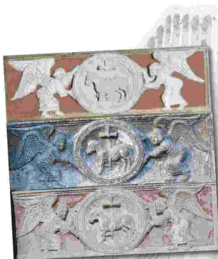
L'architrave all'ingresso sud della Cripta. Nella prima foto in alto l'immagine originaria, nella seconda foto le condizioni prima del restauro, nella terza foto il risultato dopo il restauro

Nel lato sud della basilica è stato restaurato il manto lapideo con un intervento di messa in sicurezza, con una spesa complessiva di 210mila euro che è stata coperta da finanziamenti pubblici e privati: Regione Lombardia (100mila euro), Fondazione Comunitaria della provincia di Pavia (100mila euro) e donazioni private.