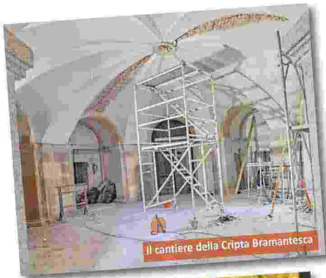
Il cantiere della Cripta Bramantesca