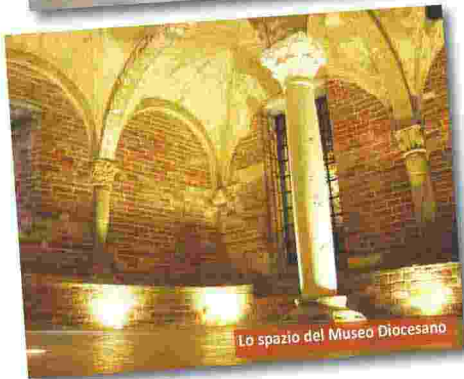
Lo spazio del Museo Diocesano