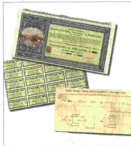
Azioni della Società della Tramvia Elettrica

“ - 160 pagine a colori - più di 30 testimoni e passeggeri intervistati - 94 fotografie e cartoline - 1 racconto inedito ”